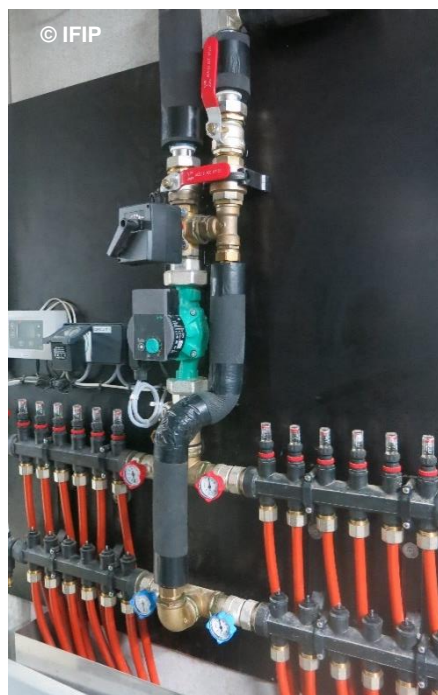
Répartition de la chaleur