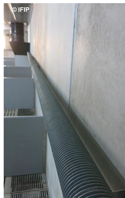
Aérotherme ou tube à ailette pour dissiper la chaleur dans les salles d'élevage