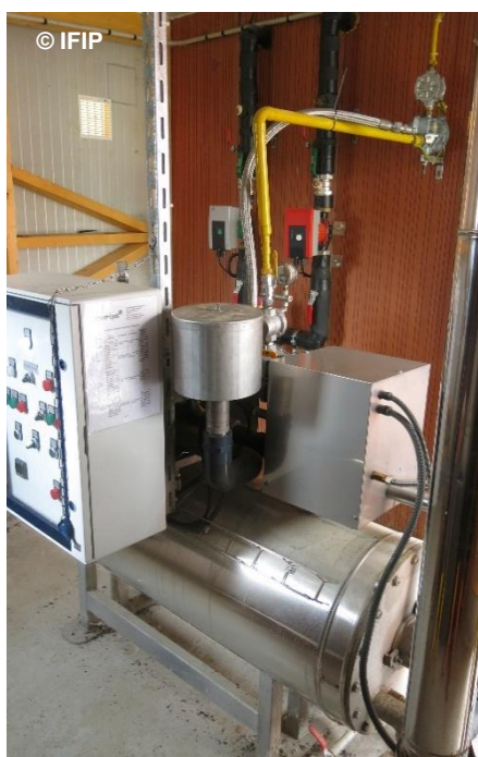
Chaudière biogaz / propane