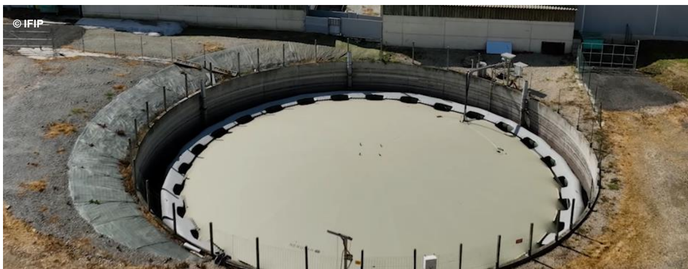
Couverture flottante de collecte du biogaz sur une fosse de 1200 m 3 de 24 m de diamètre